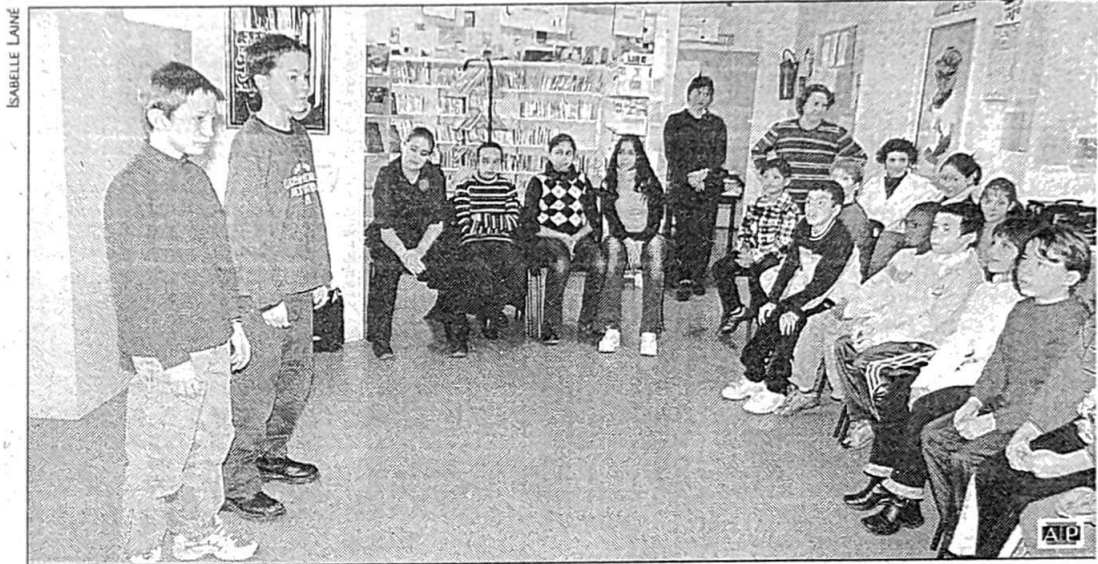
Les élèves de CM1 de l'école Géhant et ceux de 5 e du collège Rimbaud ont travaillé sur le thème du conte et confronté leurs travaux.