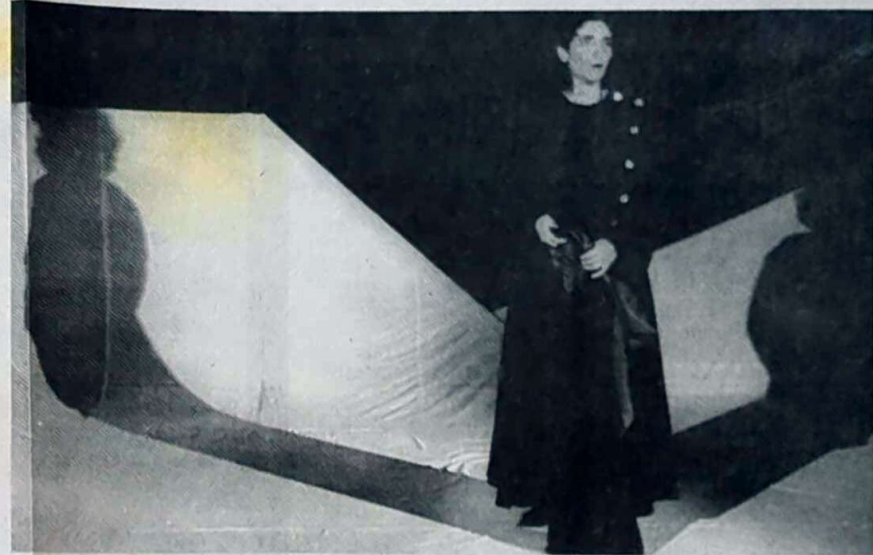
« Le secret des falaises », plus dépouillé et plus difficile d'accès repose essentiellement sur le texte.

Écrite à l'intention du jeune public, « La galibelle » (jour du rassemblement mythique de tous les goélands), est une occasion d'appréhender, surtout avec le cœur, toute la beauté