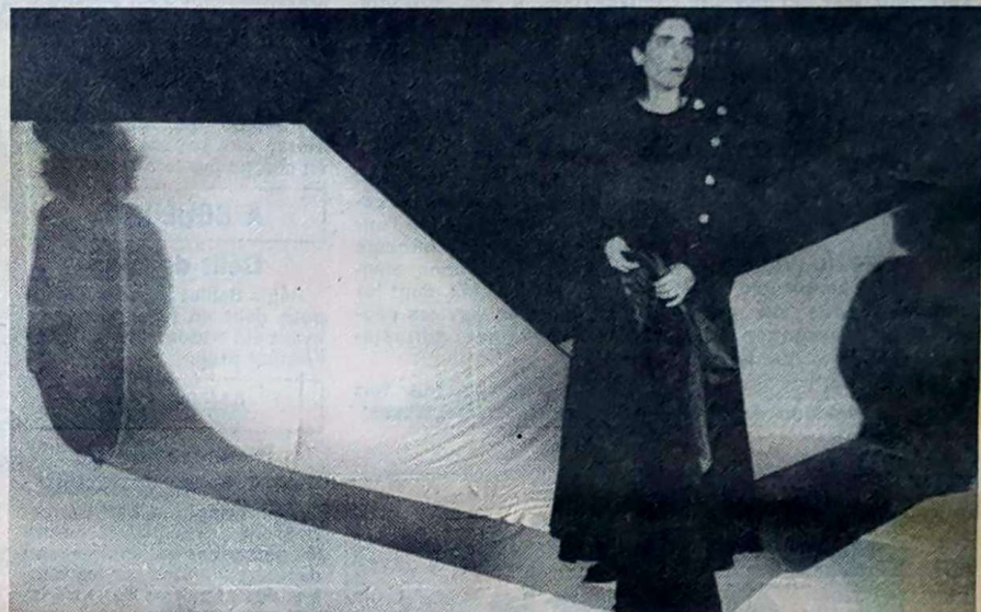
« Le secret des falaises », plus dépouillé et plus difficile d'accès repose essentiellement sur le texte.