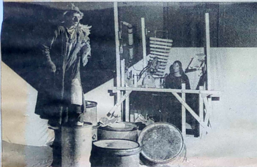
« La galibelle » ravira les enfants.

Le théâtre de l'Engéance parvient à suggérer, sur scène par la magie des mots et de la musique, l'atmosphère de la plage, le mouvement de la mer, le silence peuplé des profondeurs