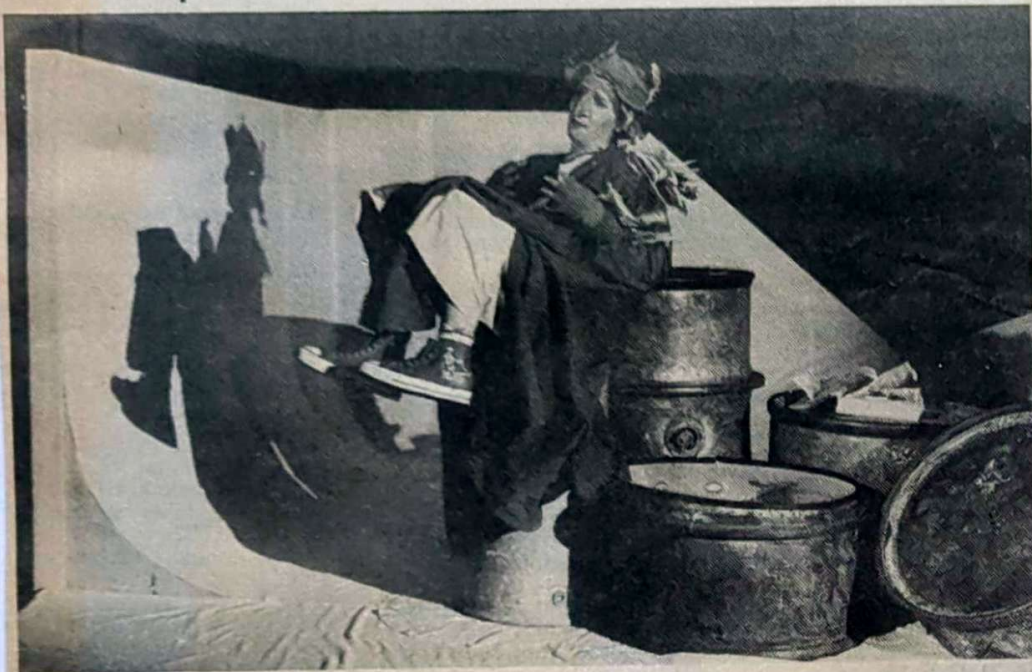
« La galibelle ».