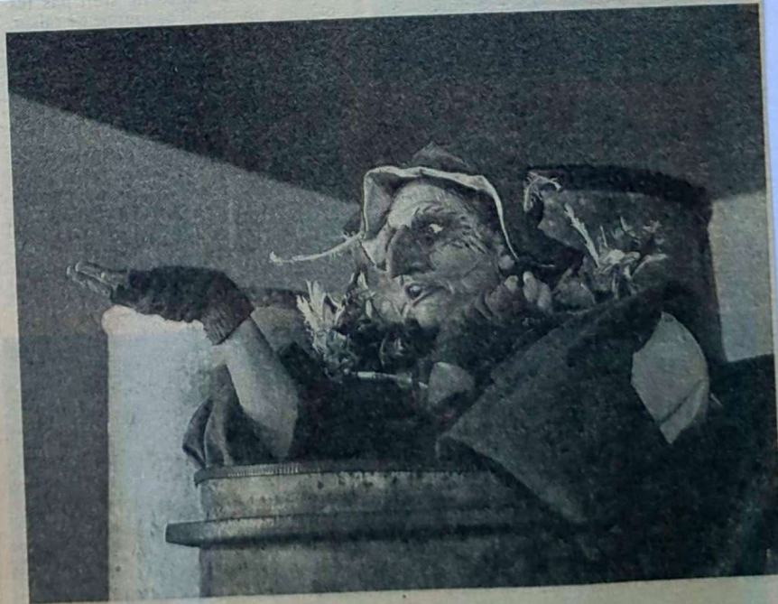
La Galibelle. Un goéland qui vit dans des bidons.