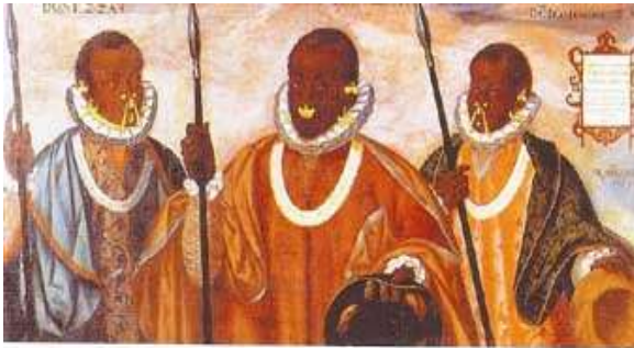
Chefs zambo d'Esmeraldas (Marrons du Brésil XVI ème siècle)